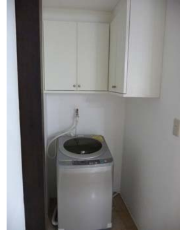
収納豊富、洗濯機置き場も機能的