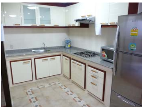
綺麗で使い勝手の良いキッチン