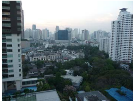
BTS プロンポン駅がすぐ近くに見えます