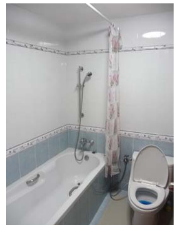
清潔で綺麗なバスルーム