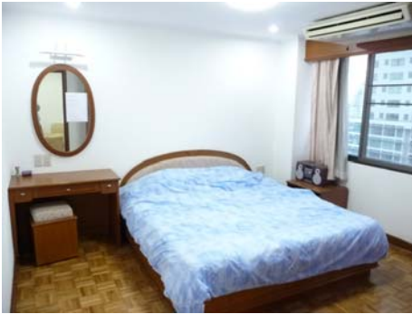
明るい寝室で、目覚めもよいかも