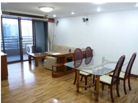
バンコクの眺望が楽しめるリビング